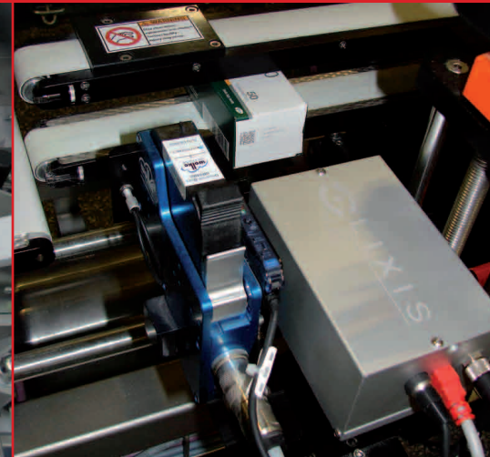
Serialización sobre cinta transportadora