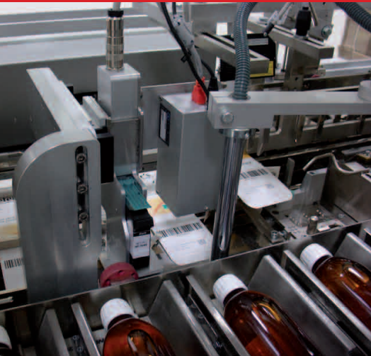
Serialización en Estuchadora