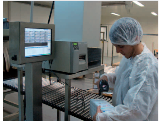
Inspección del Pack en Línea Manual